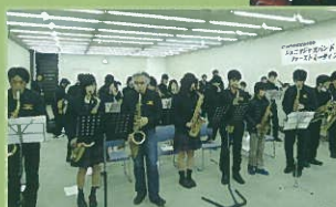
▲ダークアイズ・ジャズ・オーケストラ

出演 / 津山ジュニアジャズバンド、 ダークアイズ・ジャズ・オーケストラ、 高砂高校ジャズバンド